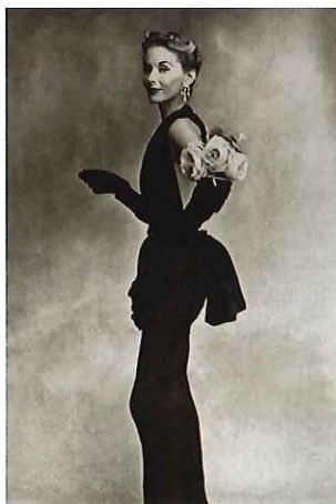
Irving Penns Woman with Roses on her Arm .